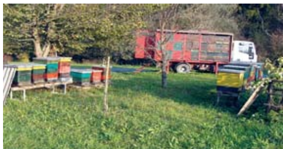
Nakladni panji in AŽ panji na kamionu

Za povečanja števila čebeljih družin po naravni poti je potrebno rojenje. Da družina prične rojiti, morajo biti izpolnjeni določeni pogoji. Najpogostejši vzrok za rojenje je preveliko število čebel v panju. Ko se družina pripravi na rojenje, čebele delavke zgradijo matičnjake. Matičnjaki so celice iz voska, ki običajno visijo z robov satja. Matica jih zaleže približno 25 in čez 16 dni se začnejo izlegati nove mlade matice. Prvorojena ali najvitalnejša, če se jih sočasno izleže več, podre vse druge matičnjake in uniči še nerojene matice, spopade pa se tudi z ostalimi, že izleženimi mladimi maticami. V panju ostane samo ena mlada matica, ki bo dozorela in poletela na oploditev.