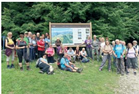
Sv. Katarina nad Zasipom

Krožek ročnih del v Domu gasilcev in krajanov ter balinanje v Športnem parku Gameljne, se do nadaljnega ne izvaja zaradi ukrepov Vlade RS za zaježitev širjenja okužb s Covidom -19.