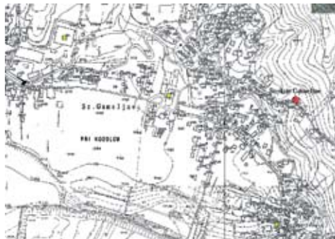
Primer prikaza priključne točke, električnega voda in vodovoda Primer prikaza poštnih nabiralnikov