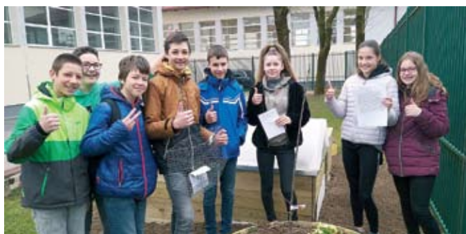
V mesecu marcu so osmošolci ob šolskem vrtu posadili jablano v okviru pobude evropske učiteljske platforme e-Twinning.

Učenci so pred izgradnjo vrta sami izdelali načrte preureditve igrišča, snovali kaj lahko posejemo na šolskem vrtu in v okviru pobude mednarodne učiteljske platforme e-Twinning posadili jablano v neposredni bližini šolskega vrta, s čimer so simbolično pokazali, da želijo po svojih močeh sodelovati pri okoljevarstvenih dejavnostih. Tudi epidemija nas ni zaustavila. Namesto na šolski vrt smo sadili kar na domačem vrtu, posneli filmčke in mimogrede naredili še kakšen zanimiv poskus. V šolskem letu 2020/21 so pred nami že nove aktivnosti, ki prinašajo inovativne pristope k poučevanju in učenju ter spodbujajo učence, učitelje in ne nazadnje ostale zaposlene na šoli k razmišljanju o novih pristopih in idejnih rešitvah, ki lahko pripomorejo h kakovostnejšemu delovnemu okolju in obenem sledijo ciljem trajnostnega razvoja.