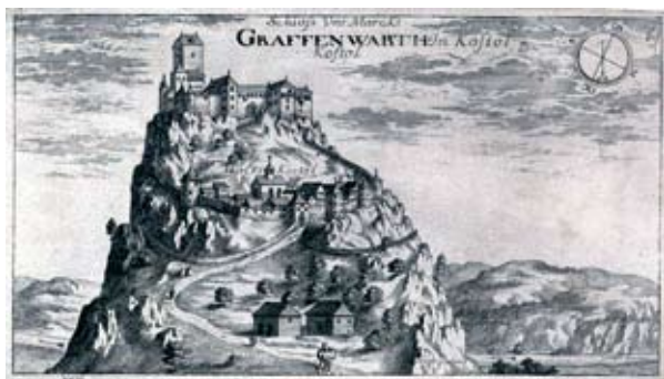
Grad in trg Kostel v Valvasorjevi Topographia Ducatus Carnioliae modernae (Topografija sodobne vojvodine Kranjske) iz leta 1679