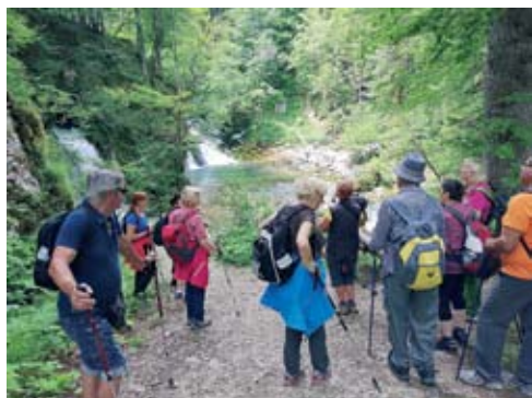
Izvir Bohinjske Bistrice