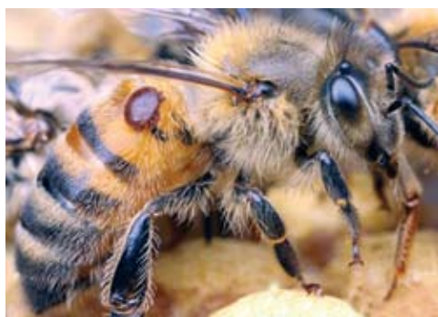
Varoa na čebeli

Čebelja družina med letom šteje do 60 000 čebel. Čebele v panju delujejo kot organizem. Posamezna čebela nima možnosti preživetja. Delo je natančno razdeljeno in se spreminja s starostjo čebele in potrebami družine. V grobem lahko rečemo, da posamezna opravila čebele potekajo na osnovi feromona, ki ga izloča matica, in glede na sporočila čebel nabiralk. Čebele, ki letajo na pašo, po vrnitvi v panj sporočajo ostalim nabiralkam o odkritem pašnem viru. To sporočijo s posebnim plesom v obliki osmice. Sporočilo je popolno, saj čebele iz njega razberejo podatke o smeri, oddaljenosti in kakovosti pašnega vira.