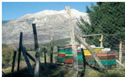
Nakladni panji v dolini Trente