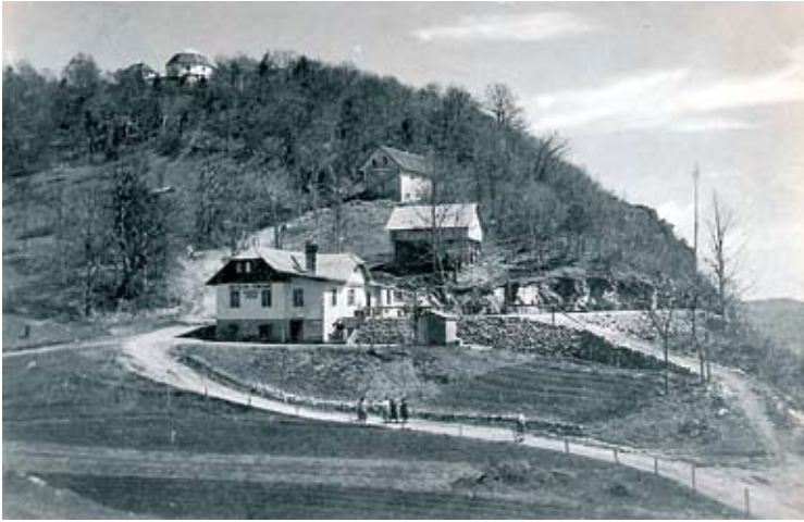
Gostilna Gorjanc na Sedlu okoli leta 1932.