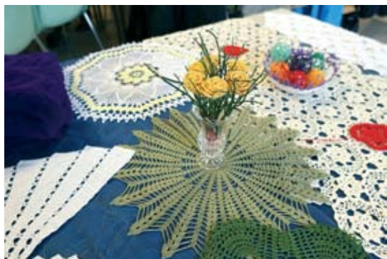
Izdelki ročnih del

Krožek ročnih del v Domu gasilcev in krajanov ter balinanje v Športnem parku Gameljne, se do nadaljnega ne izvaja zaradi ukrepov Vlade RS za zaježitev širjenja okužb s Covidom -19.