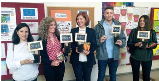
Delovno srečanje projektnih partnerjev na OŠ Šmartno pod Šmarno goro

Učenci so pred izgradnjo vrta sami izdelali načrte preureditve igrišča, snovali kaj lahko posejemo na šolskem vrtu in v okviru pobude mednarodne učiteljske platforme e-Twinning posadili jablano v neposredni bližini šolskega vrta, s čimer so simbolično pokazali, da želijo po svojih močeh sodelovati pri okoljevarstvenih dejavnostih. Tudi epidemija nas ni zaustavila. Namesto na šolski vrt smo sadili kar na domačem vrtu, posneli filmčke in mimogrede naredili še kakšen zanimiv poskus. V šolskem letu 2020/21 so pred nami že nove aktivnosti, ki prinašajo inovativne pristope k poučevanju in učenju ter spodbujajo učence, učitelje in ne nazadnje ostale zaposlene na šoli k razmišljanju o novih pristopih in idejnih rešitvah, ki lahko pripomorejo h kakovostnejšemu delovnemu okolju in obenem sledijo ciljem trajnostnega razvoja.